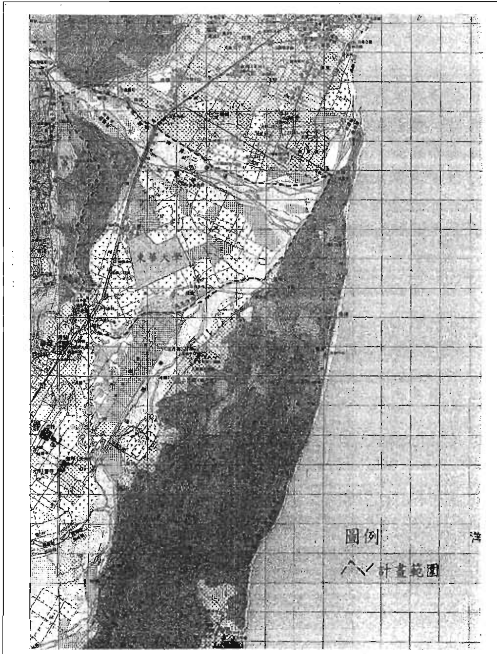
圖 1.2.1 特定區位置及計畫範圍圖

本特定區位於花東縱谷北端，北距花蓮市約十公里。行政轄區以壽豐鄉之志學、平和二村為主，北起木瓜溪，南接荖溪，東抵花蓮溪(以上均包含水域)，西以鯉魚山稜線為界，面積為 3,983.5 公頃(圖 1.2.1)。