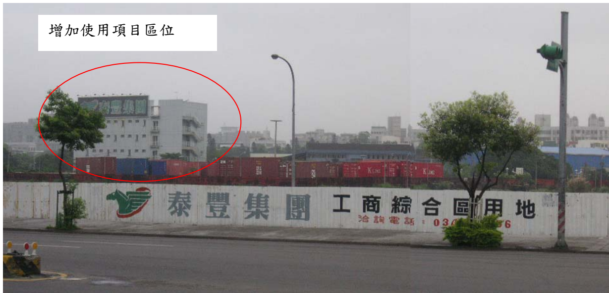
圖四 計畫現況圖片圖

本案基地位於中壢平鎮都市計畫泰豐工商綜合專用區內，屬工商綜合專用區 2-1（供社區活動中心）使用，因應地方發展需求，將該專用區作多目標使用，增加托兒所及圖書館使用項目，以提供社區托兒需求及社區居民活動與閱覽場所。