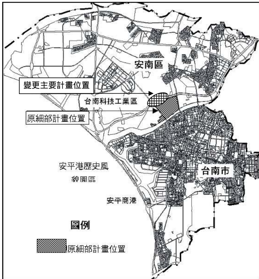
圖1 本案變更主要計畫位置示意圖

本案計畫區範圍位於台南市安南區，原台南市主要計畫 4-53-15M 計畫道路西段與台十七省道交會處及南側部份低度住宅區；變更面積約 2.39 公頃。其位置如圖 1 所示，變更計畫範圍如圖 2 所示。