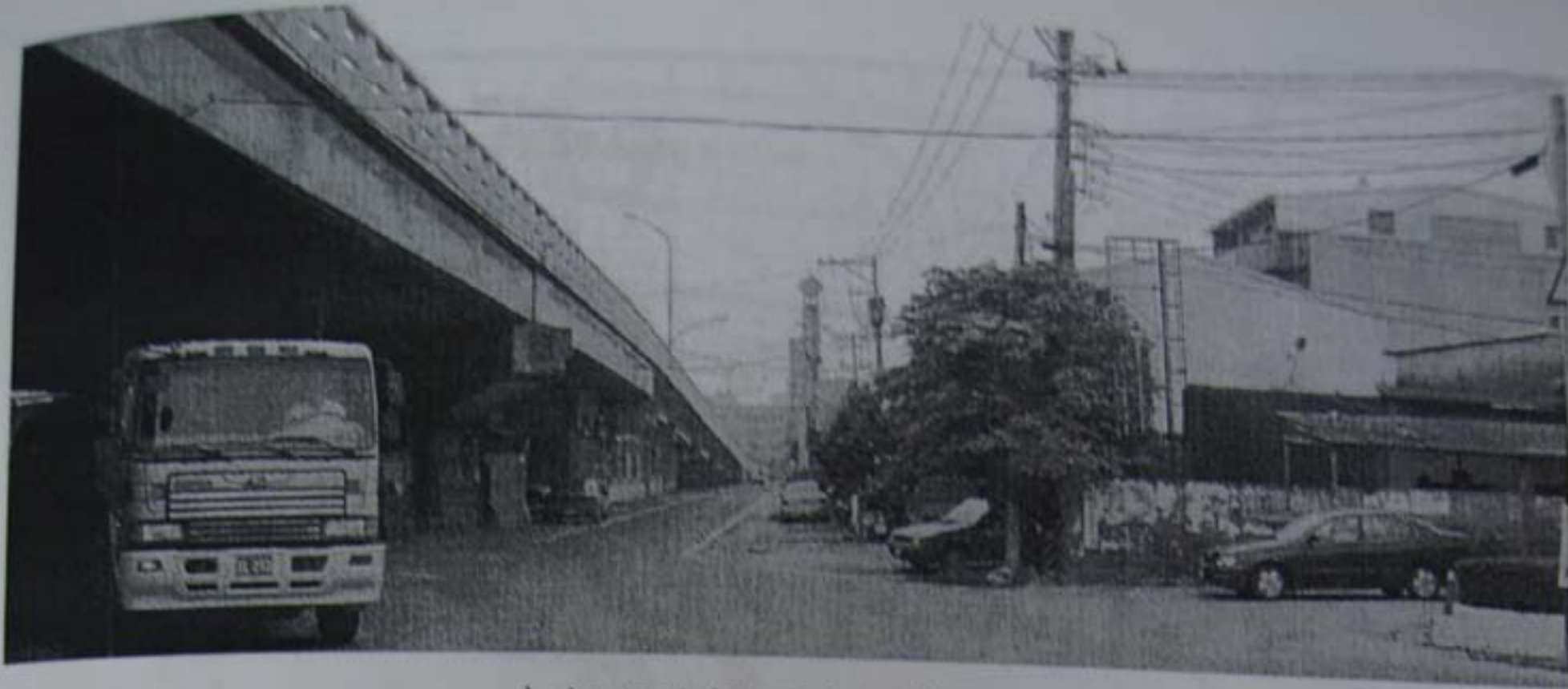
嘉新西陸橋下方側車道