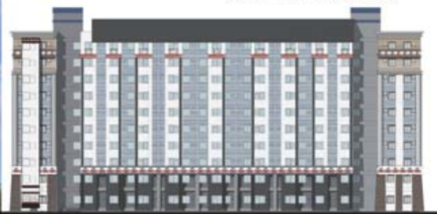
南向立面圖(高速公路)