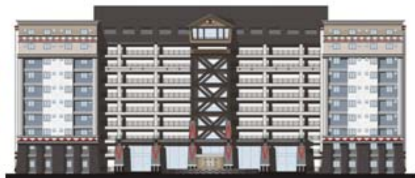
北向立面圖(隆恩街)