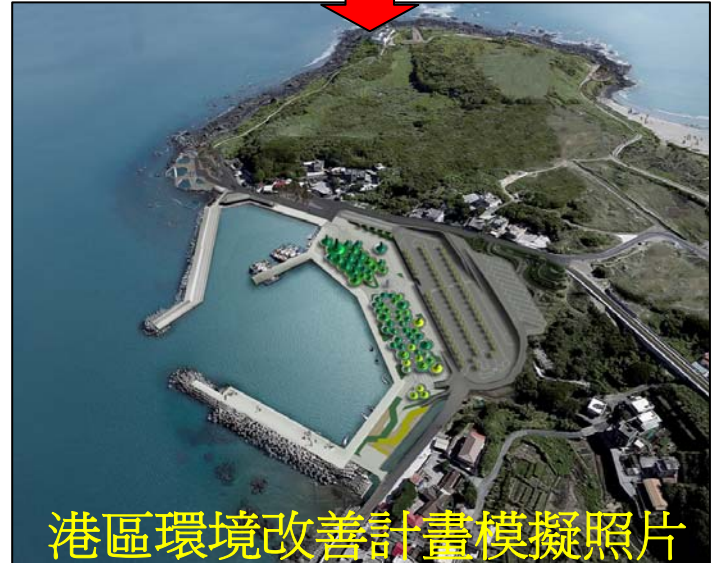
港區環境改善計畫模擬照片 提供新的休閒環境