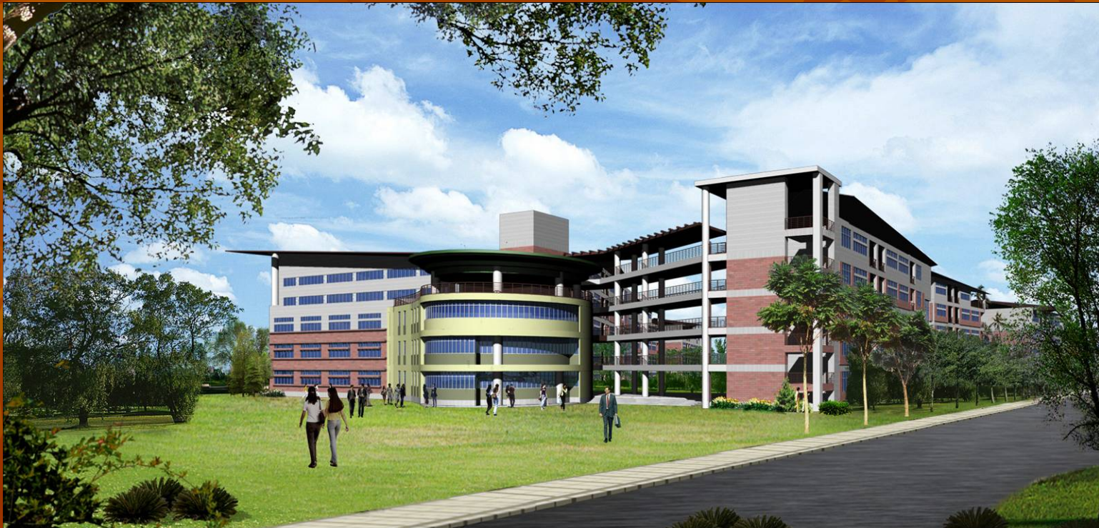
三多國中新設校校園3D意象圖