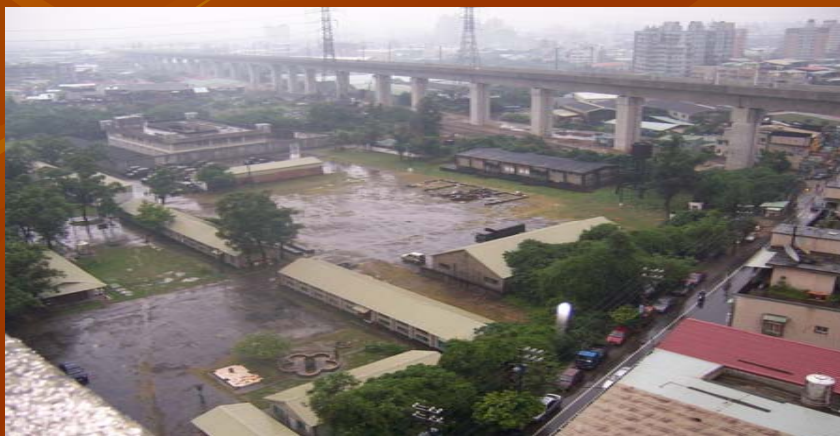
原光華營區未拆前照片