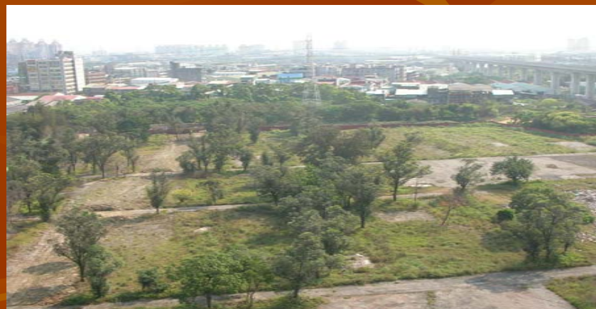
新設校預定地目前現況