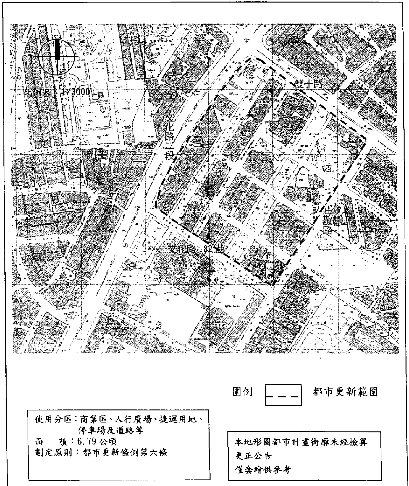
圖 1 板橋市江子翠地區人行廣場周邊商業區都市更新地區範圍示意圖