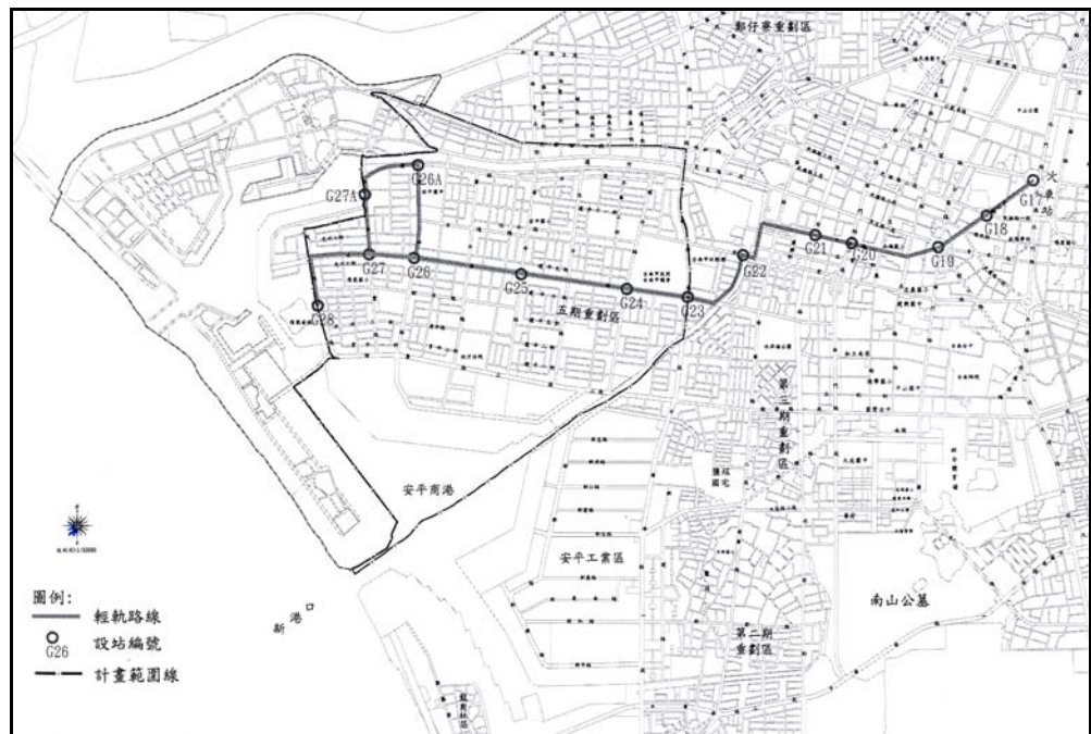
圖 2-3 台南市輕軌 路線分佈示 意圖(火車站 西段部分)